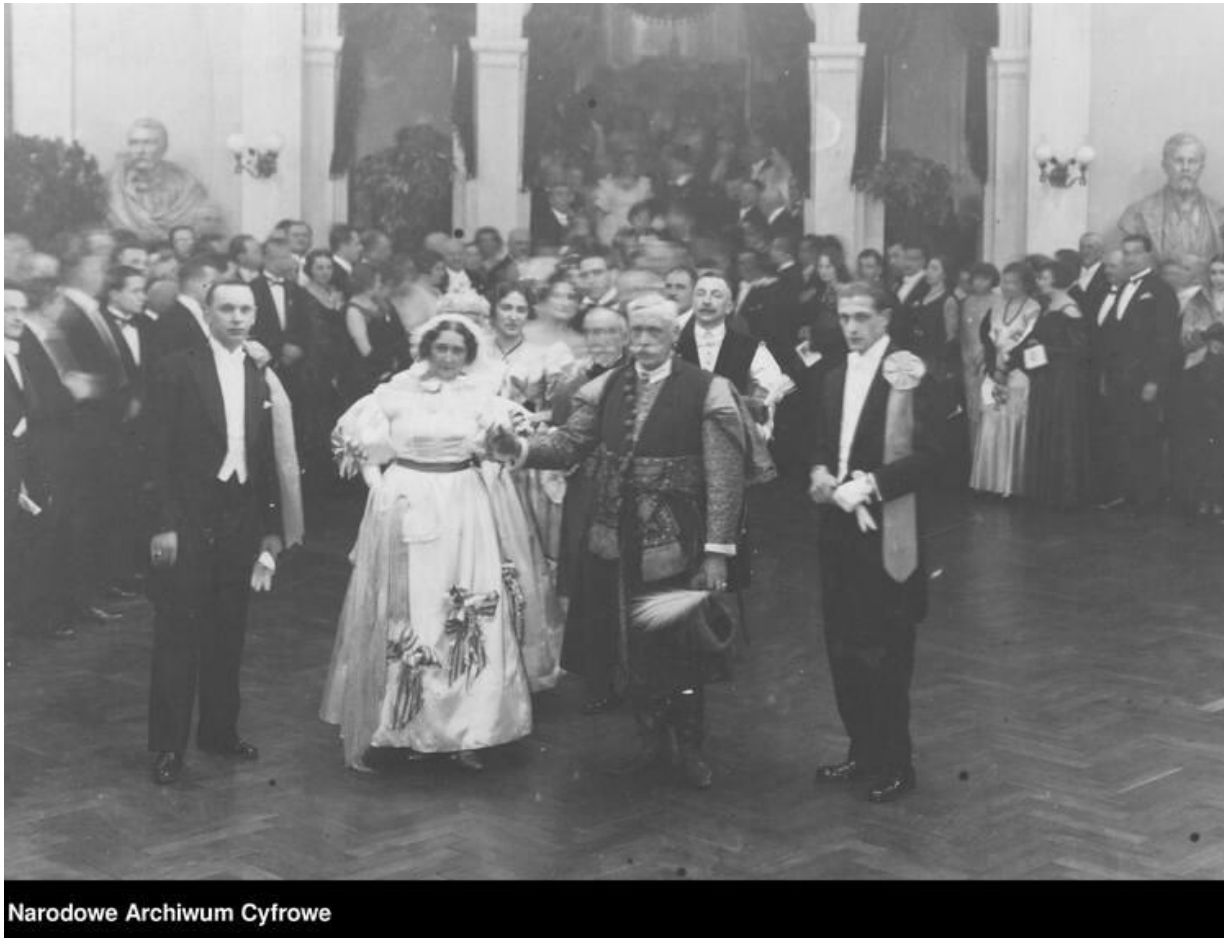
Narodowe Archiwum Cyfrowe

Przedwojenny bal prasy we Lwowie w 1931 roku. Warto dodać, że poloneza dziś tańczy się w strojach wieczorowych, jednak tradycyjnie powinny być to stroje kontuszowe (szlacheckie).