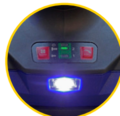
MOCNA, BIAŁA DIODA LED DO OŚWIETLENIA MIEJSCA PRACY