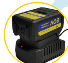
ŁADOWARKA W ZESTAWIE